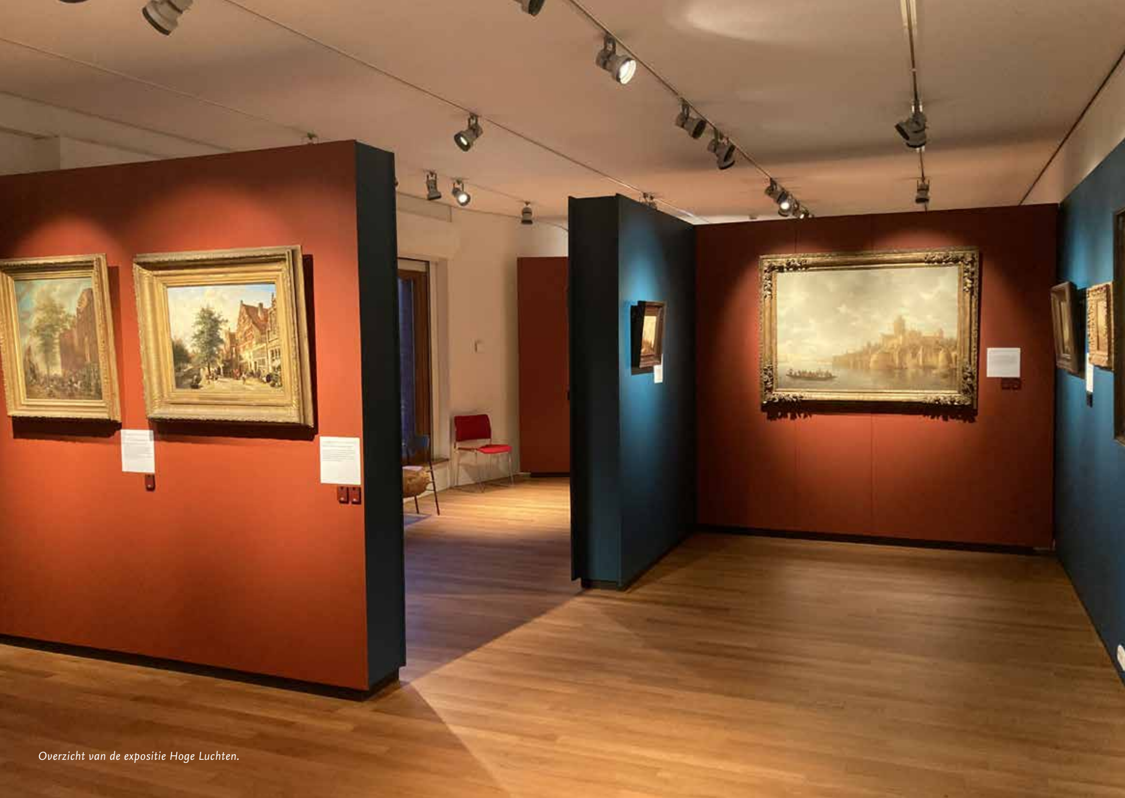
Overzicht van de expositie Hoge Luchten.