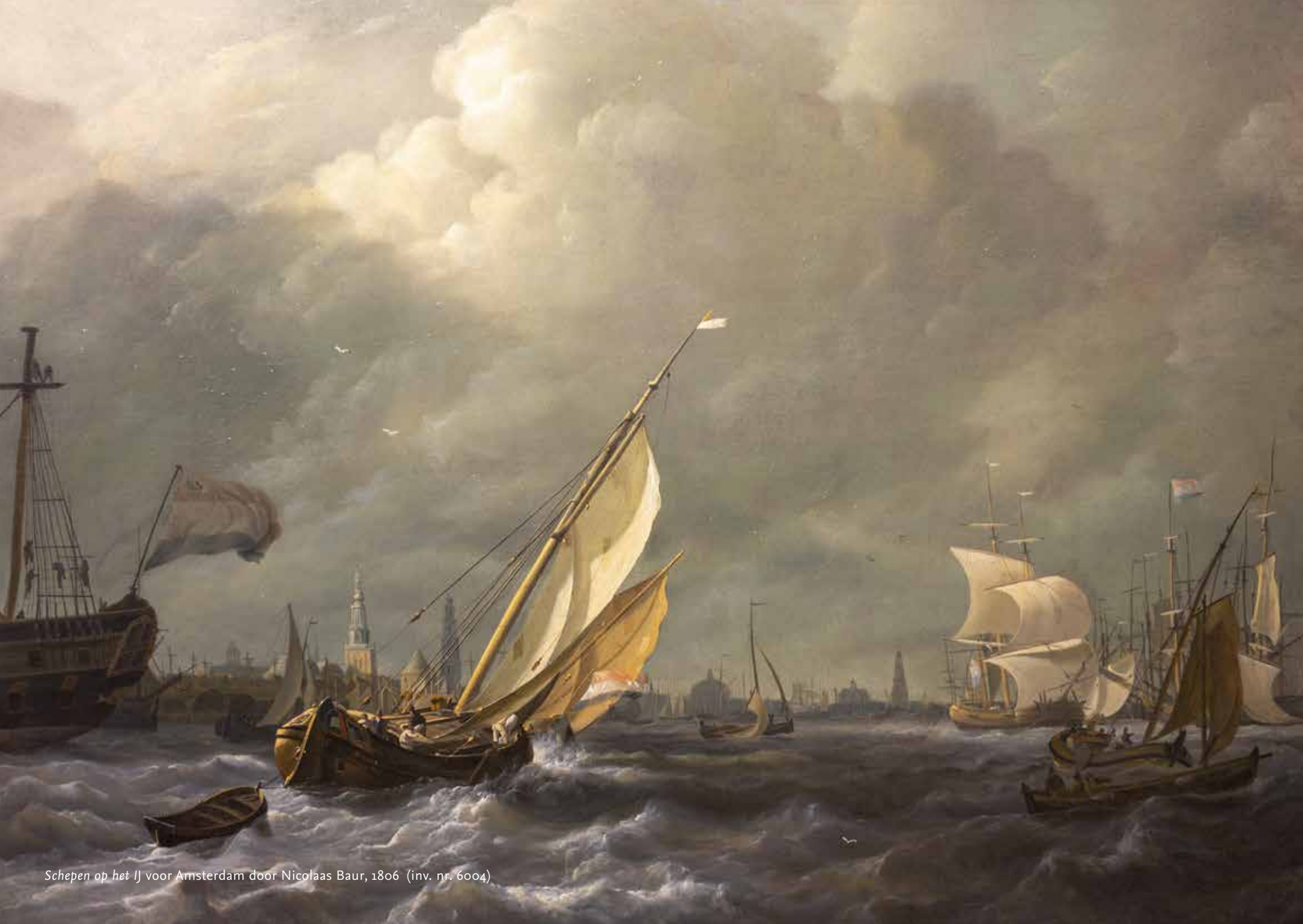
Schepen op het IJ voor Amsterdam door Nicolaas Baur, 1806 (inv. nr. 6004)