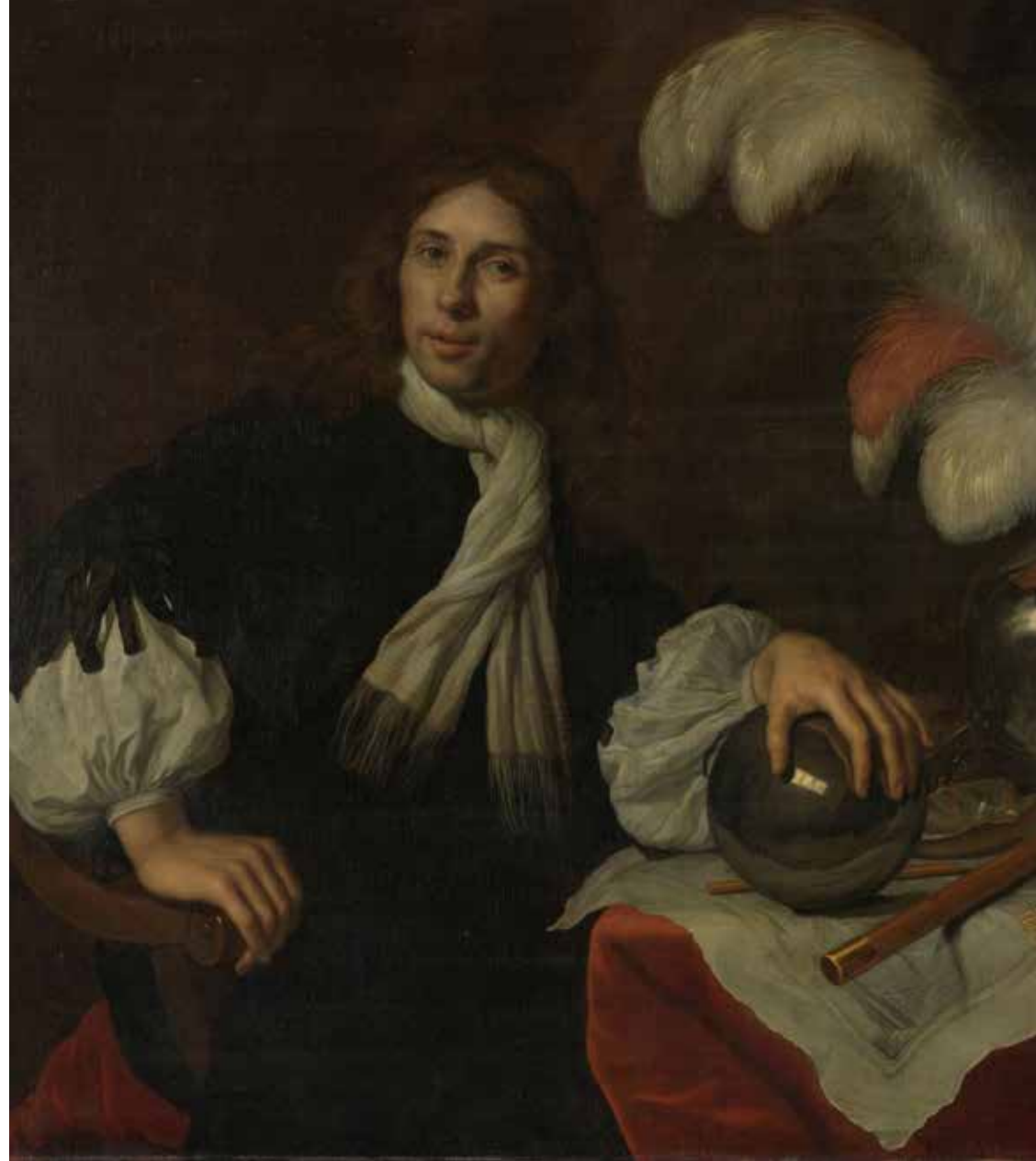
Postuum portret van luitenant Admiraal Aucke Stellingwerf, geschilderd door Lodewijk van der Helst. Langdurig bruikleen Rijksmuseum.